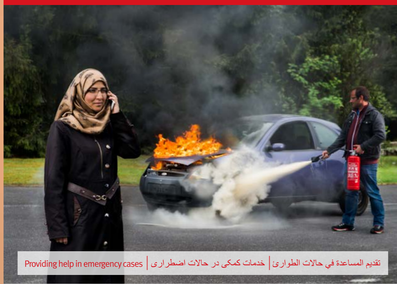
Providing help in emergency cases | خدمات کمکی در حالات اضطراری | تقديم المساعدة في حالات الطوارئ