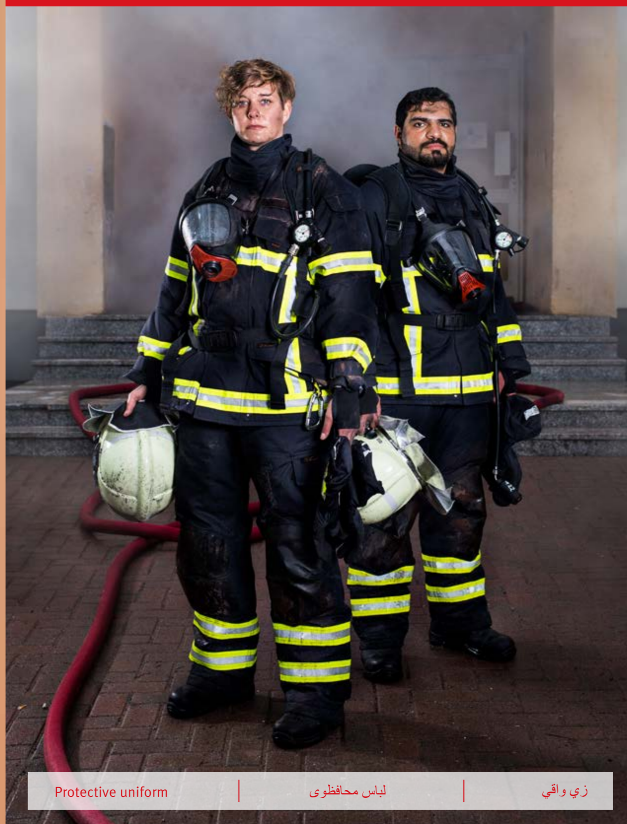
Protective uniform | لباس محافظتی | زي واقی