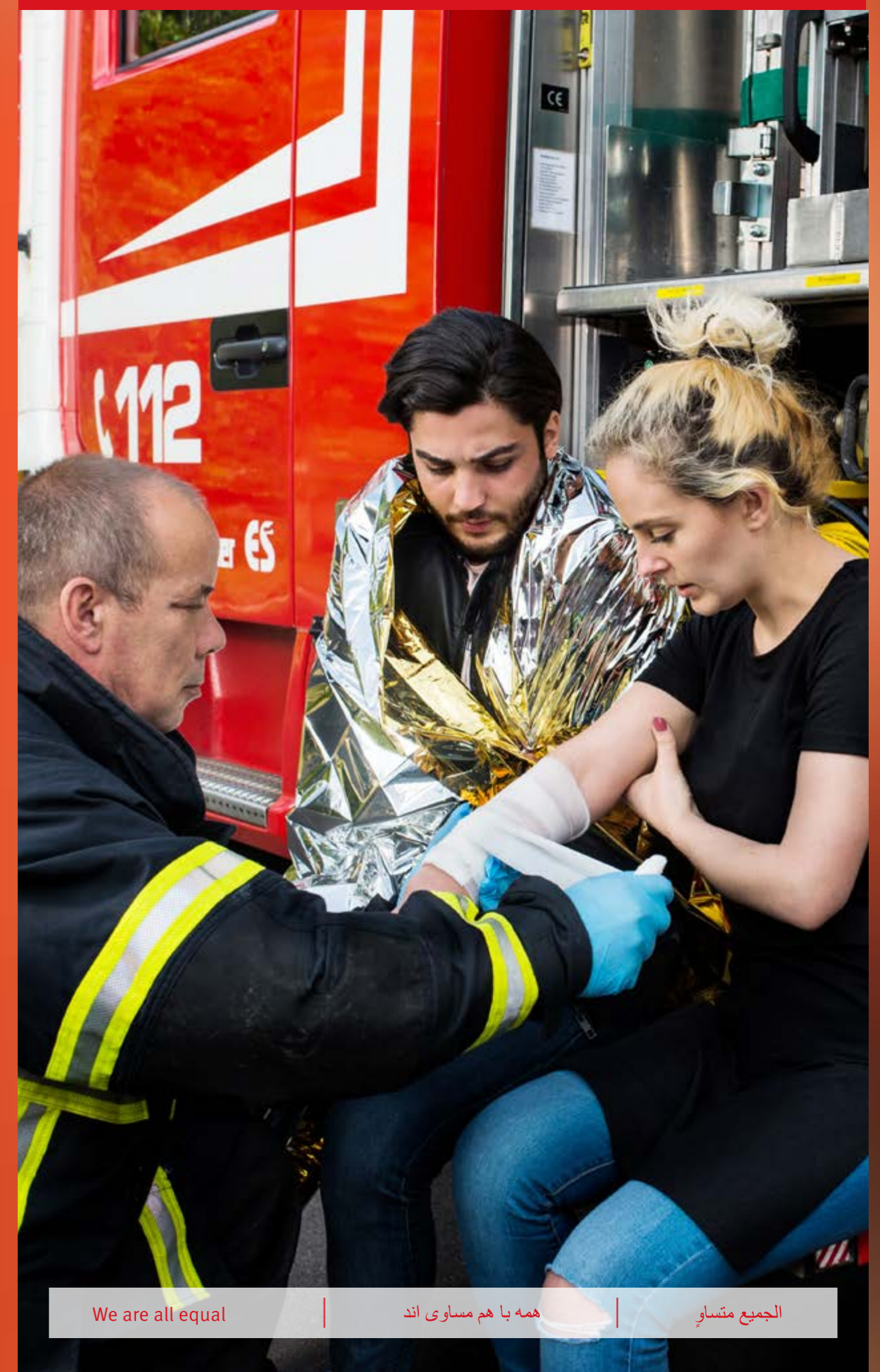
We are all equal | همه با هم مساوی اند | الجميع متساوون