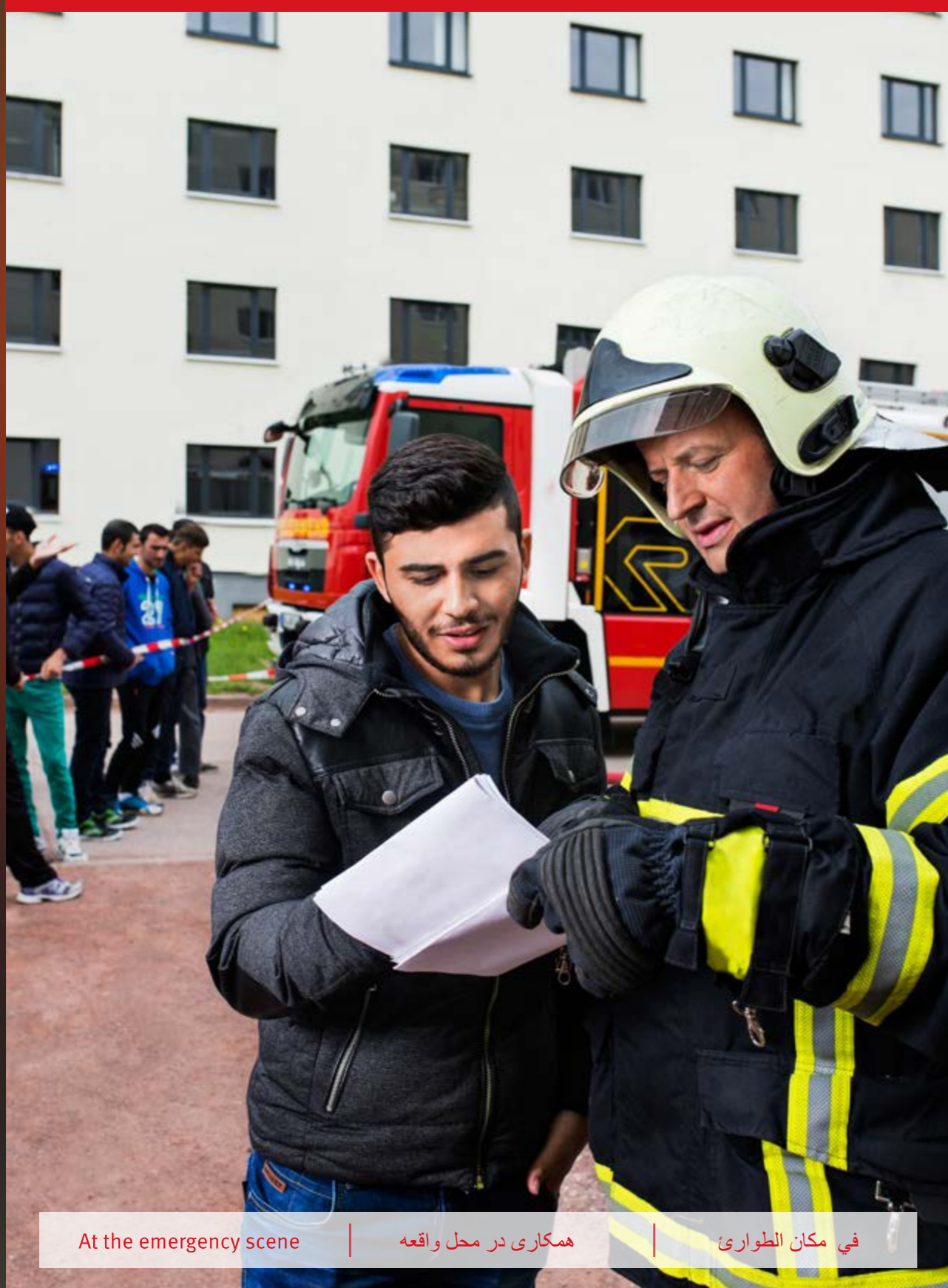
At the emergency scene | همکاری در محل واقعه | في مكان الطوارئ