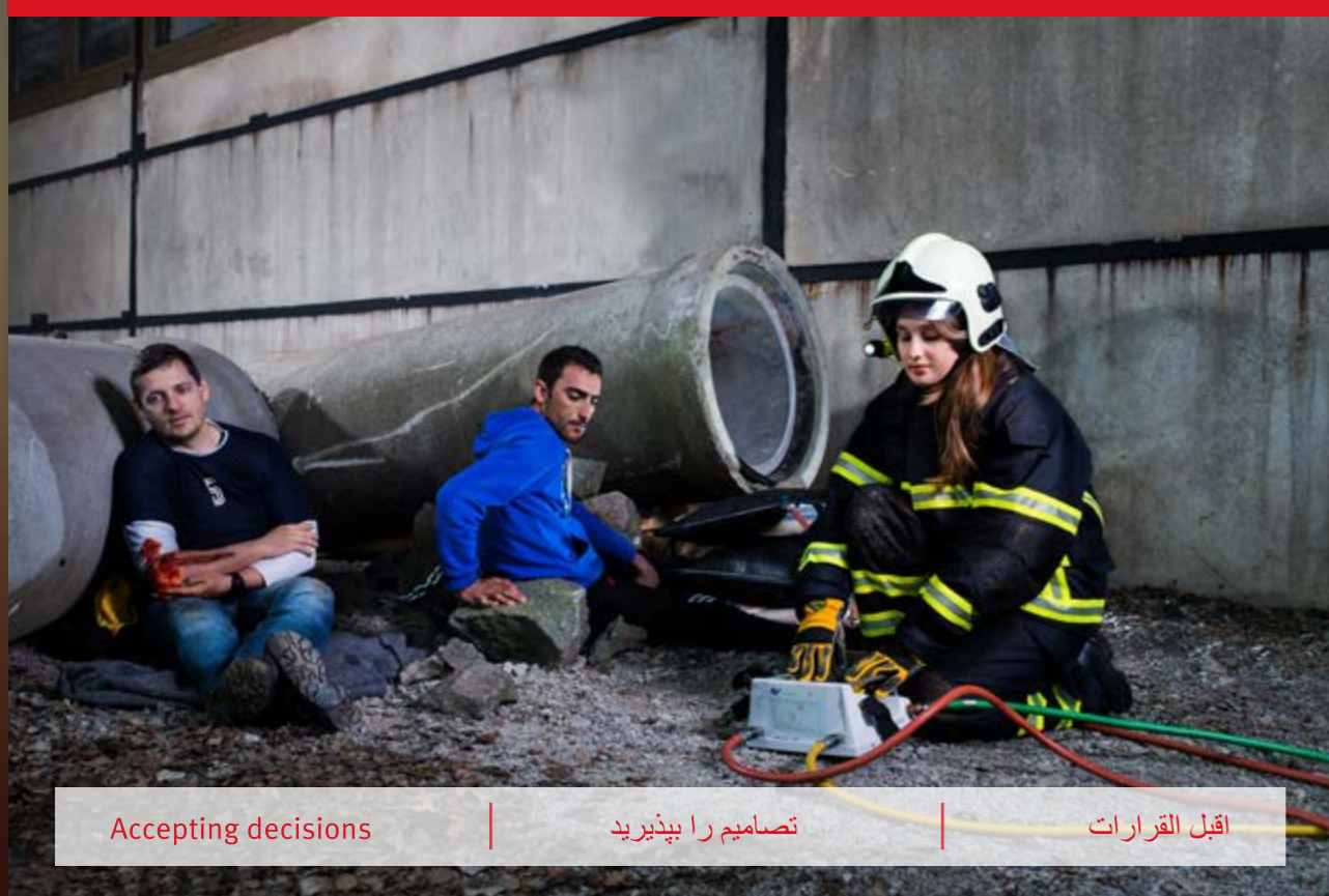
Accepting decisions | تصمیم را بپذیرید | اقبل القرارات